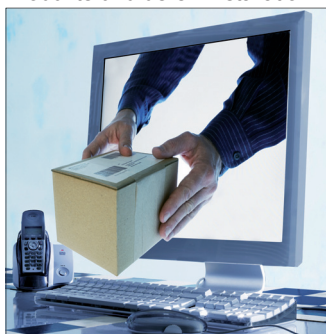
txn. Wer die Sanitärausstattung online bestellt, muss viele Faktoren berücksichtigen. Entspannter und sicherer geht es mit dem SHK-Fachhandwerk vor Ort.

bare Kostenersparnis schnell schrumpfen. Wer auf Nummer sicher gehen will, sollte daher einen Beratungstermin mit einem SHK-Handwerker vor Ort vereinbaren. Die Profis kennen sich nicht nur mit den Normen aus, sondern nehmen sich Zeit für die Bad-Planung, koordinieren auf Wunsch alles vom Trockenbau über die Elektronik bis hin zur fachgerechten Entsorgung und übernehmen neben dem Einbau auch die Gewährleistung für die Produkte und deren Installation.